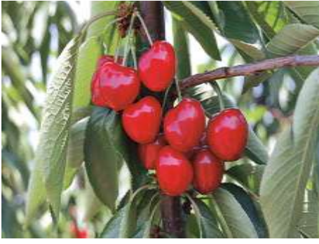
STELLA (SELF FERTİL)

Kanada orijinli, ağaçları dikine büyüme eğiliminde, orta kuvvetli gelişen çok verimli bir çeşittir. Meyveleri iri, sapı orta uzunlukta, kalp şeklinde, koyu kırmızı renktedir. Meyve eti sert, gevrek, tatlı, ince dokulu ve lezzetli sofralık bir çeşittir. Haziran ayının üçüncü haftası hasat olumuna gelir. Kendine verimli olarak ıslah edilen ilk çeşittir. Van, Bing, Vista çeşitleri bu çeşide dölleyici olarak önerilebilir. Stella kirazı kendisi ile aynı dönemde çiçek açan tüm çeşitleri döller.