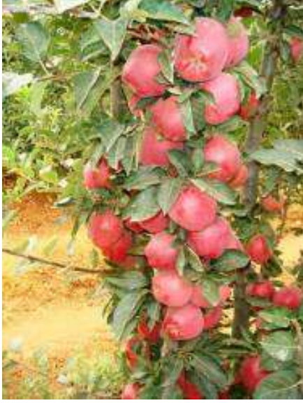
M 9 (Çok Bodur)

Bodur anaçlar içinde dünyada en çok kullanılan anaçtır. Bu anaç üzerine aşılacak elma çeşitlerinin %65–70 oranında bodurlaşmalarını sağlar. Su tutan taban arazilerde iyi sonuç vermez. Verimli topraklarda daha iyi gelişir.