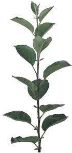
MM 106 (Yarı Bodur)

M9 anaçı üzerine aşılana çeşitlerle oluşturulan ağaçlar 15–20 yıl, hatta daha uzun yıllar bahçede kalırlar. Verimli topraklarda ağaç başına 60–70 kg'a kadar ürün alınabilir. Dekara düşecek ağaç sayısı en az 80–100 adet, verimli topraklarda ise 140–150 adettir. Dekardan 6–8 ton ürün alınabilir.