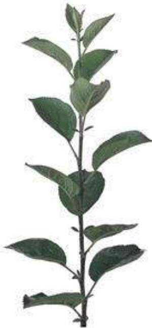
MM 106 (Yarı Bodur)

Verimli topraklarda ağaç başına 60–70 kg'a kadar ürün alınabilir. Dekara düşecek ağaç sayısı en az 80–100 adet, verimli topraklarda ise 140–150 adettir. Dekardan 6–8 ton ürün alınabilir.